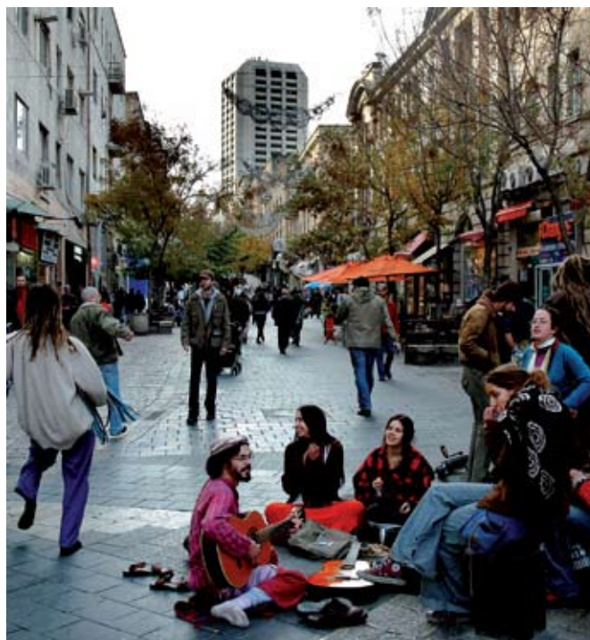
צעירים מנגנים ברחוב בן יהודה

אוסף דרשות לתורה המכונה גם "ילמדנו". מדרש תנחומא ומיוחס לאמורא הארץ ישראלי תנחומא בר אבא, מהדולי הדרשנים בארץ ישראל בסוף תקופת האמוראים (במאה הרביעית לספירה).