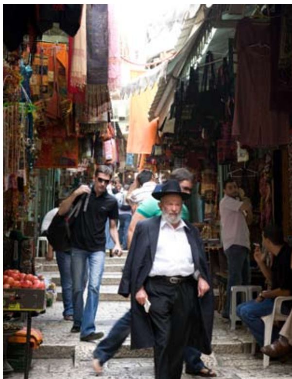
השוק ברחוב דוד בעיר העתיקה

פורסם בעיתון "ידעיות אחרונות", יוני 1994