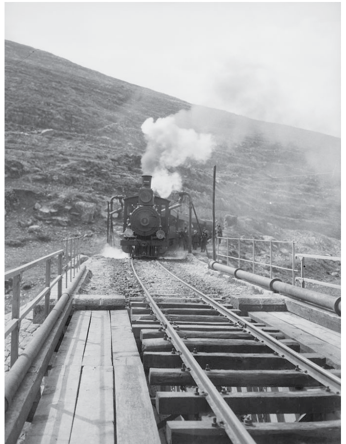
הרכבת מיפו לירושלים התחנת בתיר, 1920.

יהודה עמיחי, שיר מספר 10' במחזור השירים "טיול ישראלי", פתוח סגור פתוח, ירושלים תשנ"ח.