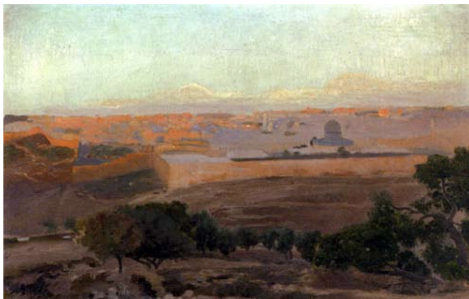
מבט על ירושלים מהר הצופים, גוסטב באוארנפינד, 1886 בערך

סופר ומשורר עברי וחתן פרס ישראל לספרות יפה. ספריו מתארים את מלחמת העולם הראשונה מנקודת מבטו של קצין יהודי. שיריו עוסקים, בין היתר, בביקורת על החברה הארץ-ישראלית. מייסד התיאטרון הסאטירי העברי בארץ-ישראל. שירו הנודע ביותר הוא 'מעל פסגת הר הצופים' אשר לצד שירה של נעמי שמר 'ירושלים של זהב' משמש המנון עממי לירושלים.